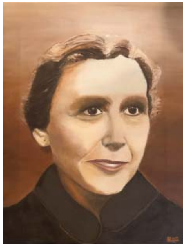
Retrato pintado por: Rosario González Cascón

Cada capítulo refleja un aspecto esencial de dicha espiritualidad, a través de la selección de textos que propone cada autora, de manera que cada capítulo tiene su entidad, pero es el conjunto de los ocho el que ofrece una visión más integrada de su espiritualidad. Si recorremos estos ocho capítulos nos vamos a encontrar con el primero, "Una vocación laical" de María Rita Martín Artacho, que pone el acento en una vocación laical. El segundo, "Espiritualidad cristocéntrica, inspirada en Teresa de Jesús" de Lucía Pedrosa-Padua nos presenta textos que muestran la centralidad de Jesucristo y la referencia a Teresa de Jesús. A continuación, el capítulo tercero "Oración y estudio" de Carmen Azaustre Serrano, ofrece textos